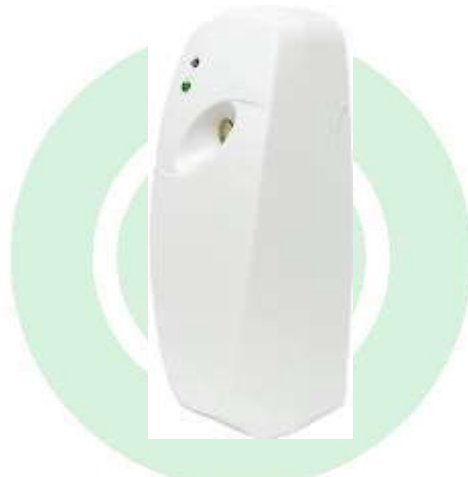
FIGURA 2. Dispensadores automáticos (Dispensers). Atenção: as imagens das armadilhas são ilustrativas.