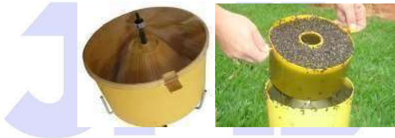
FIGURA 3. Armadilha Ecológica (biológica). Atenção: as imagens das armadilhas são ilustrativas.