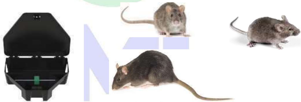
FIGURA 5. Pontos Permanentes de Envenenamento (PPE'S) apropriadas para instalação no perímetro do HCN. Atenção: as imagens dos dispositivos são ilustrativas.