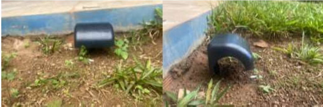
FIGURA 4. Pontos Permanentes de Envenenamento (PPE'S) apropriadas para jardins.