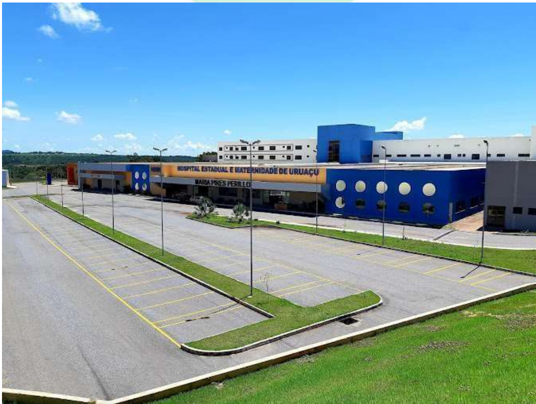
FIGURA 4. HCN - HOSPITAL ESTADUAL CENTRO NORTE GOIANO GO.

RELATÓRIOS: Serão enviados Relatórios de Monitoramento Mensal, Procedimento Operacional Padrão (POP), Mapas, Certificados, Fichas Técnicas e FISPQS dos venenos utilizados e demais documentações necessárias.