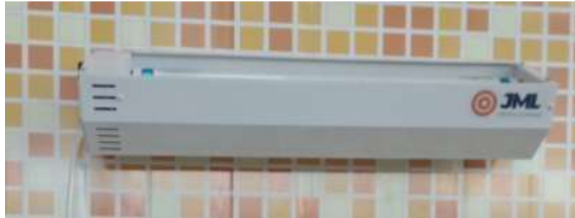
FIGURA 1. Armadilha luminosa. Atenção: as imagens das armadilhas são ilustrativas.