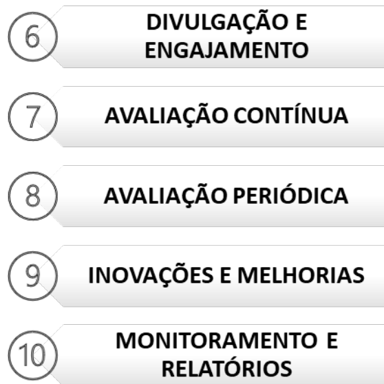
Figura 1: Etapas da implementação do Programa de Educação Permanente em Saúde.