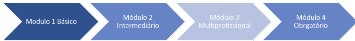
Figura 2: Apresentação dos Módulos